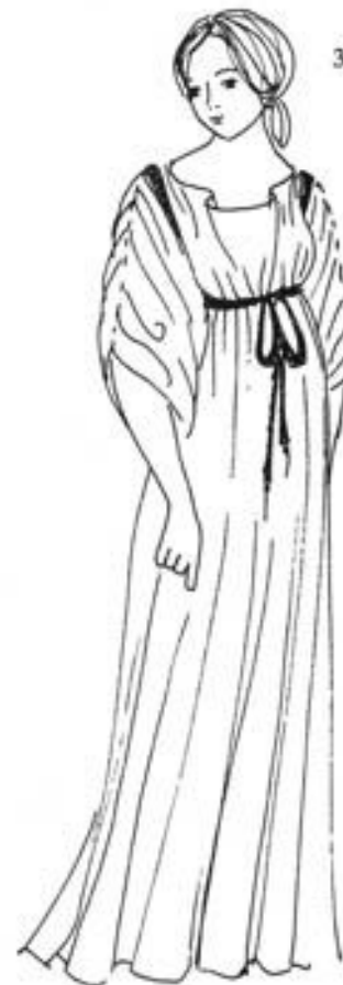
СПИНТЫЙ ХИТОН хитон, подобный ионическому, но рукава не скреплены застежками, а спинты