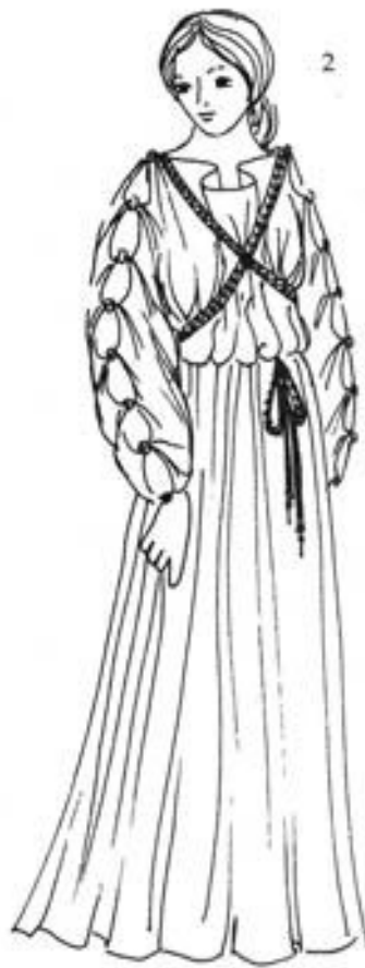
ИОНИЧЕСКИЙ ХИТОН Очень широкий хитон, скрепленный ещё и вдоль рук, формируя таким образом рукава