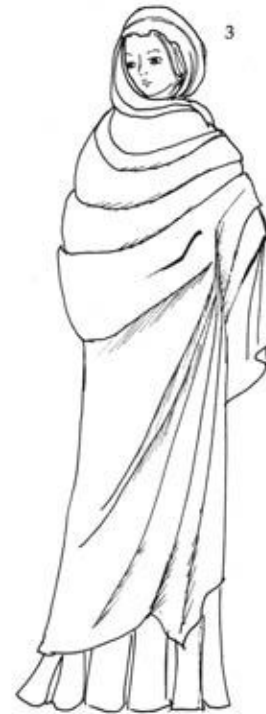
ГИМАТИЙ, закрывающий голову