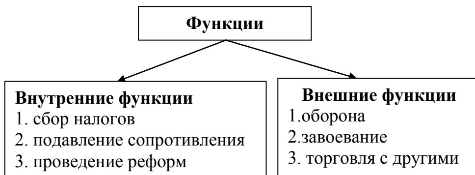
Рис.2 Схема. Функции государства.

В ходе обсуждения на доске составляется схема. Сначала выделяются внутренние и внешние функции государства. Затем каждая группа уточняет проявление внешней и внутренней функций на конкретном примере, описанном в историческом документе, с которым она работала.