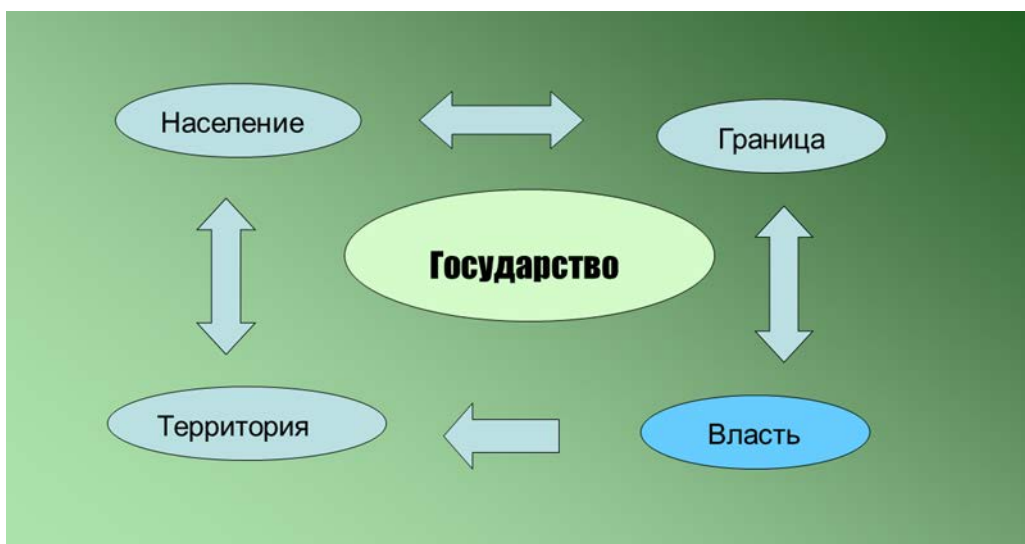
Рис.1.Схема «Признаки государства»

Поскольку при классификации производится распределение предметов (явлений, фактов) по группам (классам), которые занимают определенное место в общей системе, то одной из удобной формы выражения классификации является схема. Она отражает основные, существенные черты исторических явлений, событий.